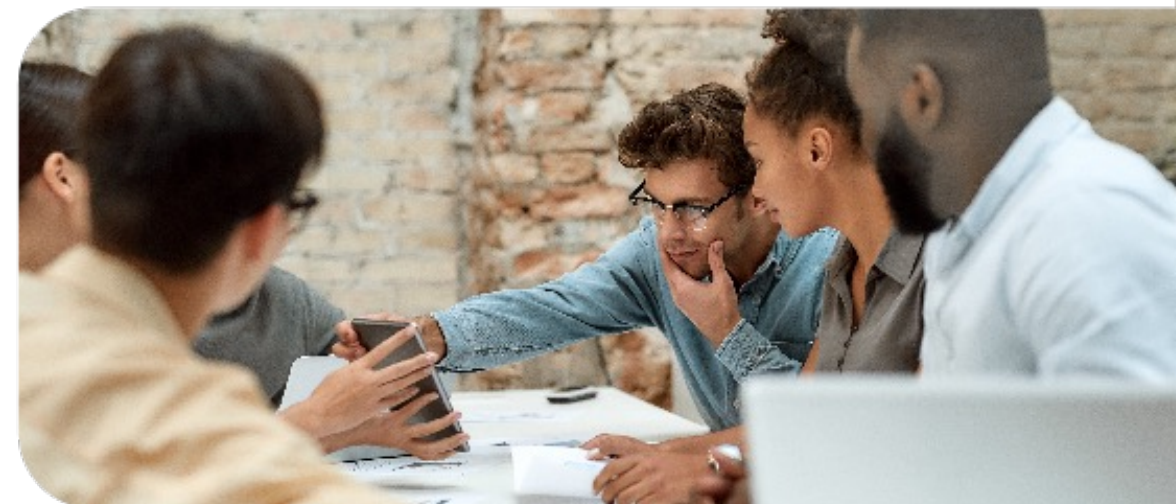
Exemplos de ações relacionadas as diretrizes de colaboradores

Manter disponível procedimentos de Ombudsman tanto para orientar e aconselhar os colaboradores, quanto para tratar suspeitas, denúncias e reclamações sobre desvios éticos e práticas contrárias às políticas institucionais, como assédio moral ou sexual, discriminação, desrespeito e conflitos interpessoais e de interesses no ambiente de trabalho.